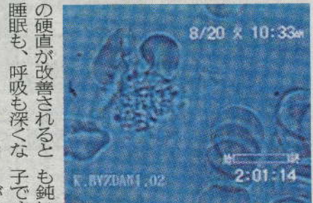
動きの悪い白血球 (02年8月20日)

状態です。このよつな 状態では血液の循環も 悪く、気管支や胸腺の 循環も低下していま す。気管支の循環障害 は咳を誘発し、胸腺の 循環障害が自己免疫疾 患を誘発します。胸腺 は、ウイルスに対して 抗体をつくるTリンパ 球を産生しています が、胸腺の循環障害か